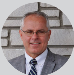
作者：马特-金斯伍德 罗素RP教会牧师

愤世嫉俗者又要说“又是一天”的时候了。的确每个月一月一日都是新的一年的开始。在这个新的一年，也就是2024年，我们将迎来新一期的《海阔天空》！基督徒的生活是奇妙且有恩典的，充满了“新”事物。通过圣灵的工作，我们在耶稣基督里有了新生（约翰福音3:3）、新约（希伯来书9:15）、新人（以弗所书4:24）、新生（罗马书6:4）、新歌（诗篇98:1），以及新天新地的应许（启示录21:1）。使徒保罗在《哥林多后书》第5章17节中总结了福音的恩典和荣耀，“若有人在基督里，他就是新造的人，旧事已过，都变成新的了。”在新的一年到来之际，「基督徒是新的生命」这一原则给了我们极大的盼望。我们需要盼望，因为我们都还在处理生活、罪、和环境中的“旧”事。因为这些都不能像翻日历一样翻过去。并不是所有的“新”的东西都是容易的或好的。政治家和营销者以“新”为名向人们兜售他们的东西。好像凡是“新”的东西就是好东西，至少比较好。在新的一年里，你可能确诊得了“新”病、“新”的心痛或心碎、“新”的失业潮，或某种“新”的困难。希望无论神的旨意是什么，我们都能以信徒的身份说：“愿颂赞归于我们主耶稣基督的父神！他曾照自己的大怜悯，借着耶稣基督从死里复活，重生了我们，叫我们有活泼的盼望”（彼得前书1:3）。作为神挚爱的儿女，我们每天都可以通过耶稣为我们开辟的又新又活的路（希伯来书4:16, 10:20）来到恩典的宝座前。今年，当我们日复一日地过着基督徒的生活时，每个早晨都有新的应许，这是主的怜悯（《哀歌》3:23）。愿新一期的《海阔天空》能帮助你在新的年里铭记神的应许，并确信祂的信实“我终身的事在你手中”（诗篇31:15a）。