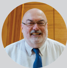
作者：艾伦-麦克劳德 多伦多 RP 教会牧师牧师

约翰一书 4:10，不是我们爱神，乃是神爱我们，差他的儿子为我们的罪做了 挽回祭 ，这就是爱了。