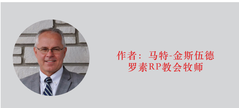
作者：马特-金斯伍德 罗素RP教会牧师

16世纪德国新教改革家马丁-路德曾说过：“我们的主将复活的应许不只是写在书本里，还写在每一片春天的树叶上”。每年春天都出现的“新”生命是一幅图画，指向在基督，复活的救主和主里的新生命，这个必将实现的新生命充满了祝福和应许。当然，任何源于自然的“神学”都必须在圣经的特殊启示中才能真正找到，并接受检验。正是在《圣经》的书（“叶子”）中，我们可靠地认识了唯一的中保，主耶稣基督，以及祂的生平、死亡和复活。我们确实地知道“祂复活了”，这不是从春日里一片含苞待放的叶子上，而是从上帝无误无谬的话语中获得的。耶稣的复活以大能宣告祂是神的儿子（罗马书 1:4）。我们的信不是徒然的！（哥林多前书 15:17）。带着活泼、得救的信心与耶稣联合，意味着复活的力量和祝福运行在我们的生命中。当我们死在过犯中的时候，便叫我们与基督一同活过来（以弗所书 2:5）。与被钉十字架又复活的救主联合，意味着我们向罪当看自己是死的，向神当看自己是活的（罗马书 6:11）。我们作为基督徒要知道上帝为我们这些信的人所赐的无比大能，甚至是复活的大能（以弗所书 1:19）。我们复活的救主是所有信靠之人初熟的果子。在祂里面，我们有一个活泼的盼望，那就是有一天祂会借着祂的大能“祂要按着那能叫万有归服自己的大能，将我们这卑贱的身体改变形状，和祂自己荣耀的身体相似”（腓立比书 3:21。你不需要等到春天才知道复活，也不需要等到春天才接受复活的救主。今天就是救赎之日！以赛亚书 1:18，就如大雪可以描绘宽恕，春天的树叶也可以提醒你基督和复活。“我知道我的救赎主活着，末了必站立在地上。我这皮肉灭绝之后，我必在肉体之外得见神。我自己要见他，亲眼要看他，并不像外人。我的心肠在我里面消灭了！”，《约伯记》 19:25-27。