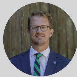
作者：科林·波斯特马 渥太华RP教会长老

加拿大正处于关键时刻。这是个转折点，我相信钟摆要摆动。这是一个契机，教会可以趁此机会向那些肉体和精神上都已破碎的人传讲基督里的盼望，让他们获得真正的身份认同。