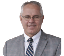
作者：马特-金斯伍德 罗素教会牧师

我们这个尚在起步阶段的宗派，已经申请加入 NAPARC，并请求北美改革宗长老会（RPCNA）与联合长老会（ARP）作为我们的申请推荐教会。请为这一过程祷告，求主赐下祝福，也为我们与志同道合之教会持续的团契祷告。同时，也盼望你能重新省思你个人以及你所在教会，与当地其他基督徒之间的关系。要记得，耶稣曾说：“不敌挡我们的，就是帮助我们的。”（可9:40）