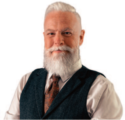
Rev. Scott Wilkinson 'The Ascension of Christ'